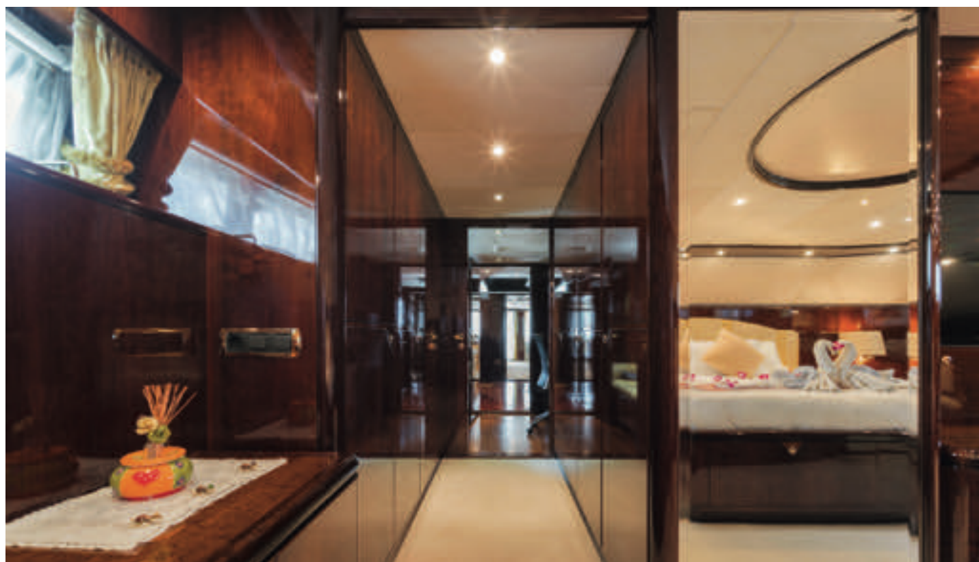
Gangen fra Master Bedroom og ud til salonen.

Superyachten Xanadu cruiser i Andamanerhavet ud for ferieøen Phuket. Der er flere hundrede palmeøer i området, hvor man kan ankre op ved deres strande.