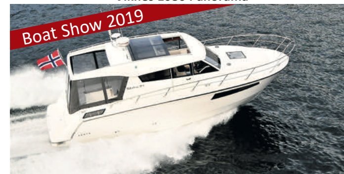
Skilsø 34 Panorama