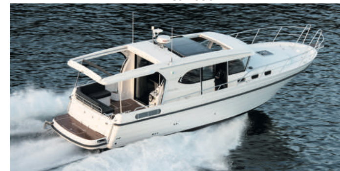
Viknes 1080 Panorama