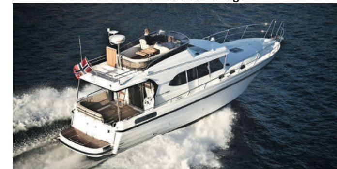
Viknes 1080 Sunbridge