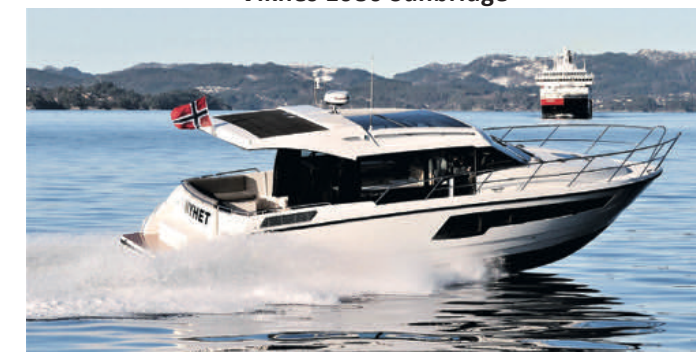
Skilsø 39 Panorama