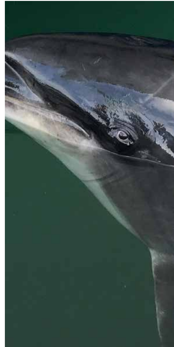
En delfin kom på besøg.

Og efter en nat, hvor vi rullede en del, stod vi tidligt op og sejlede til Île d'Yeu.