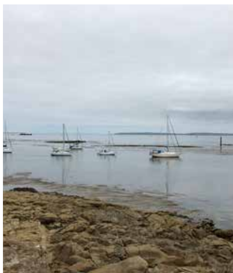
I beskyttelse ud mod Atlanten.