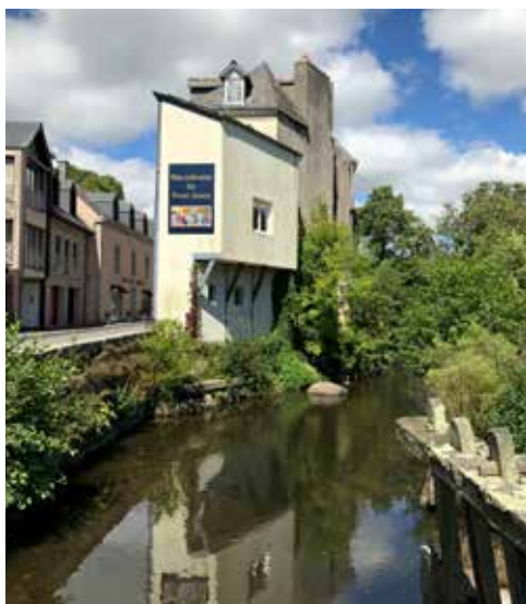
Sådan udnyttes pladsen til et endehus.