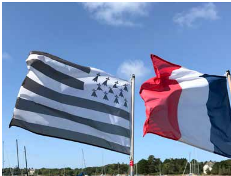
Bretagnes regionalflag ved siden af det franske flag. Det kaldes Gwenn-ha-du, hvilket betyder hvid og sort på bretonsk.