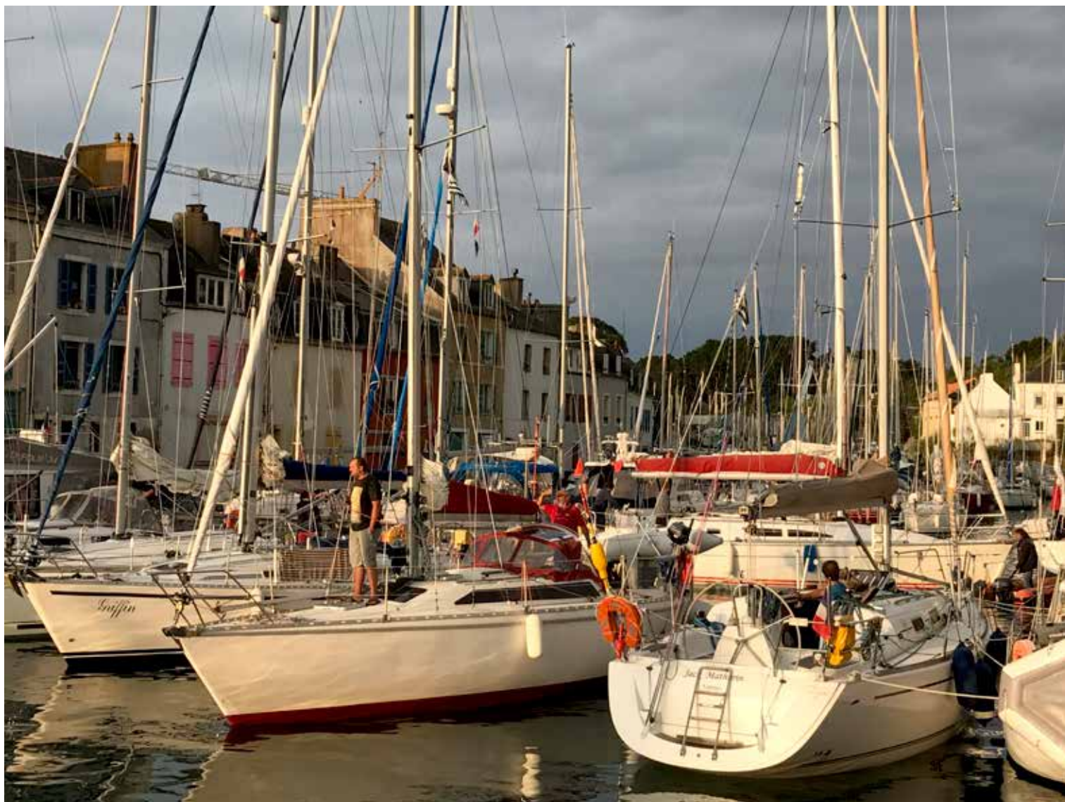
Hyggelig havn i dejligt solskin.

det, ved stærk strøm, at se den lille færge sejle nærmest sidelæns over til fastlandet. Det var der vi besluttede os at prøve den, når tidevandet vender og strømmen er mindst.