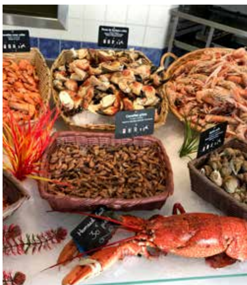
Skaldyr i alle afskygninger i Loctudy.