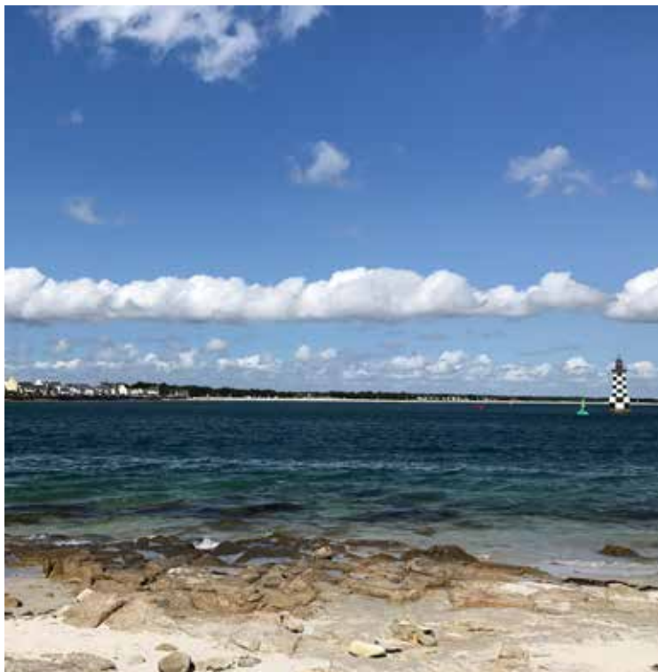
Bugten ved fyrtårnet på Île de Penfret (Les Glenans).

Priseksempel: For en 10 m båd kostede det 394 € i 2018. En overnatning koster i gennemsnit omkring €20 pr. nat, så alt over 20 overnatninger er en gevinst. Læs mere: passeportescalles.com/en/latitude-morbihan