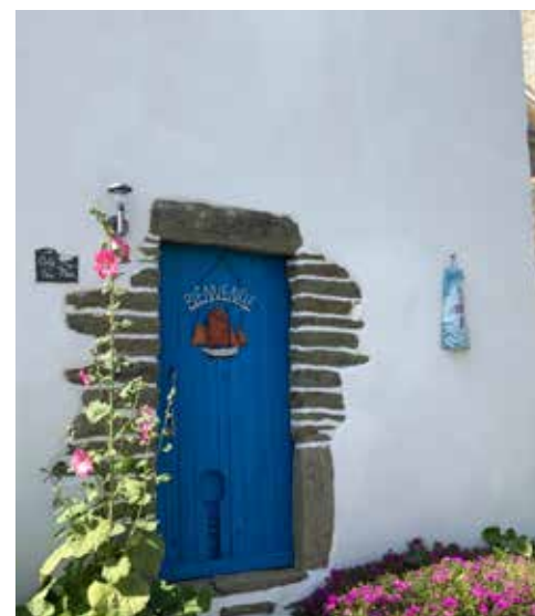
Hus på Île de Groix.

hvor vi lige sejler. Så her slugte vi Peter May's "Freeze Frame", som foregår her på øen. Når vi derefter cyklede og gik rundt på øen, fandt vi flere af de steder, der var beskrevet. Øen er meget fredelig og idyllisk, men havnen er et oplevelse for sig. Havnen er meget lille, og med stor tidevandsforskel, så der er udlagt tre rækker med 4-5 store bøjer.