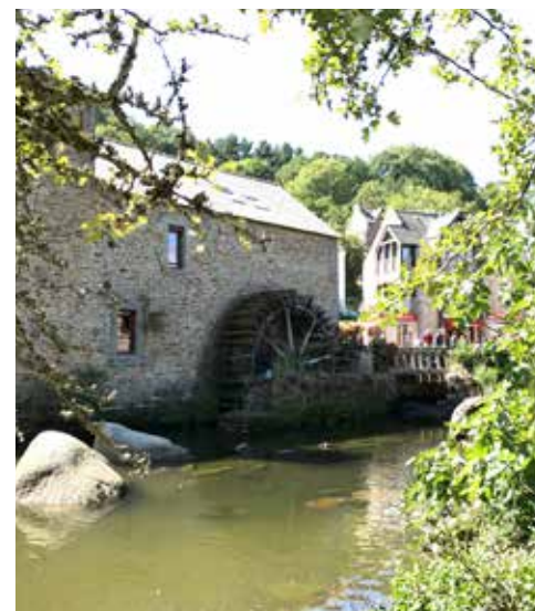
Den gamle mølle.