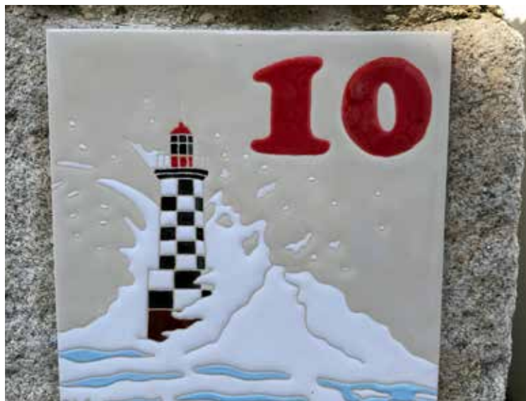
Husnummerskilt på Île Tudy.