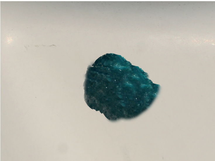
5 Kom spartelmasse i det forberedte hul. Massen hælder på 10 min., og er klar til finish slibning.