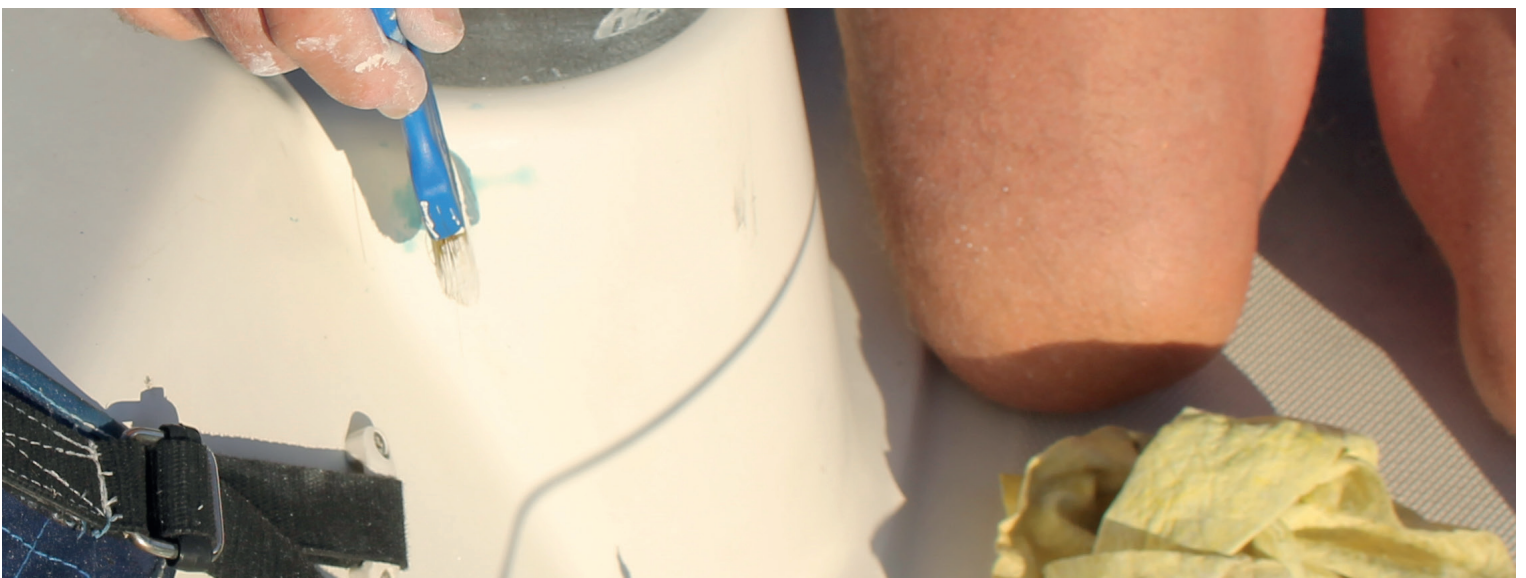
7 Gør slutbehandlingen nem med enkomponent topalkydlak. Påfør malingen med pensel. Den flyder fint sammen, og penselspor forsvinder hurtigt. Derfor er efterpolering ikke nødvendig.