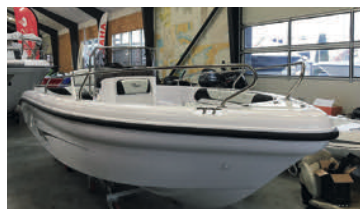
RANIERI VOYAGER 17

GIV DIN BÅD NYT LIV, FÅ WRAPPET DIN BÅD! DER ER STORT UDVALG AF FARVEKOMBINATIONER, BESKYT BÅDEN OG FÅ DEN FRISKET OP I EN FARVE DU SELV VÆLGER. DER GIVES 7ÅRS GARANTI! FÅ ET UFORPLIGTENDE TILBUD.