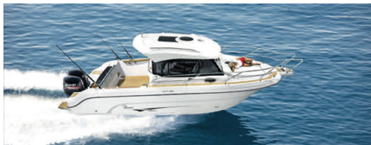
RANIERI CLF 30

VI LAVER NYE HYNDER, KABINER, SÆDER SAMT ANDRE FORMER FOR POLSTRING. FÅ ET UFORPLIGTENDE TILBUD.