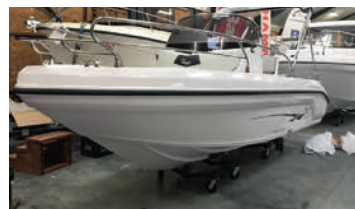
RANIERI SHADOW 19

2019. Søgelænder, automatisk lænepumpesystem, skydedør, klappbord, vindskærm, PRIS FRA 212.900