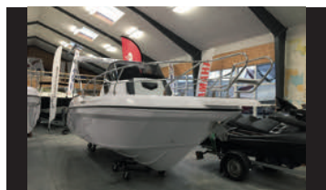
RANIERI NEXT 220 SH

2019. Klassisk walkaround båd med lækre detaljer.