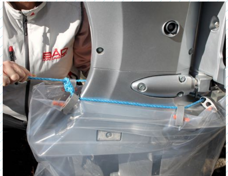
2 Før opspændingssnoen ind gennem grippene og bind enderne sammen.